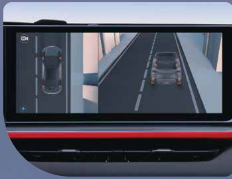
• Cámara panorámica de 360°