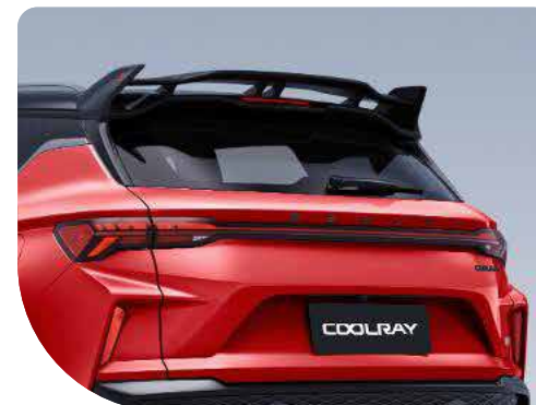
• Spoiler deportivo

*Imágenes de carácter ilustrativo, consulta las versiones y especificaciones disponibles en tu concesionario Geely más cercano.