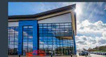
Coventry - UK