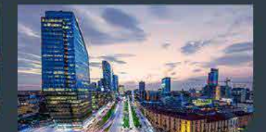
Milan - Italy