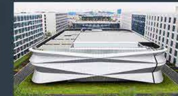
Ningbo - China