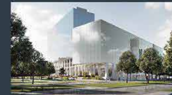
Gothenburg - Sweden