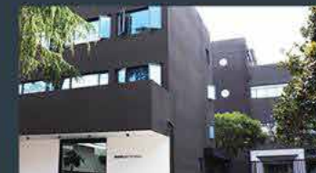
Shanghai - China