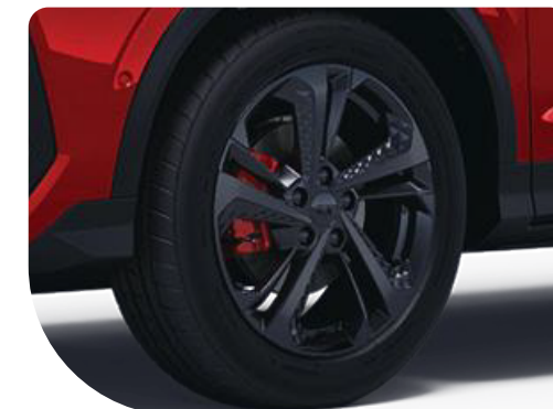
• Rines de 18"