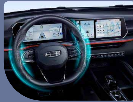
• Asistente de estacionamiento automático