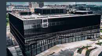
Gothenburg - Sweden