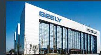
Hangzhou - China