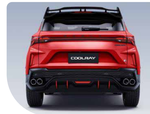
• Escape doble bilateral