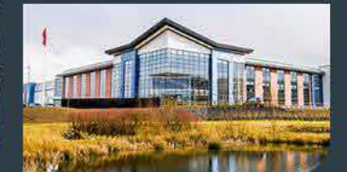
Coventry - UK