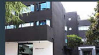
Shanghai - China