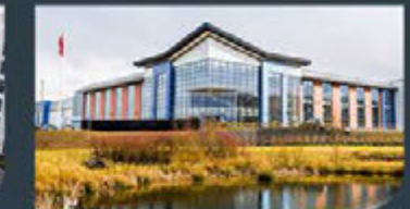
Coventry - UK