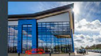
Coventry - UK