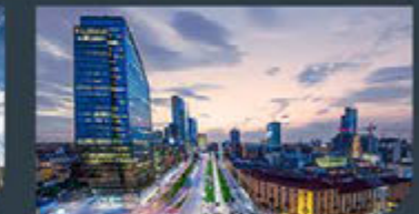
Milan - Italy