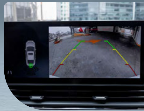
• Cámara de reversa con líneas dinámicas y sensores de estacionamiento traseros