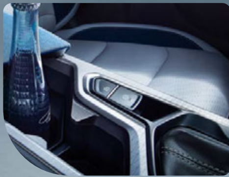
• Freno de mano electrónico (EPB) con Auto-Hold