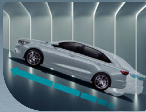
• Asistente de arranque en pendiente (HAC)