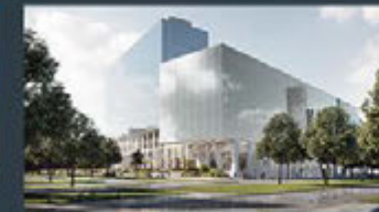
Gothenburg - Sweden