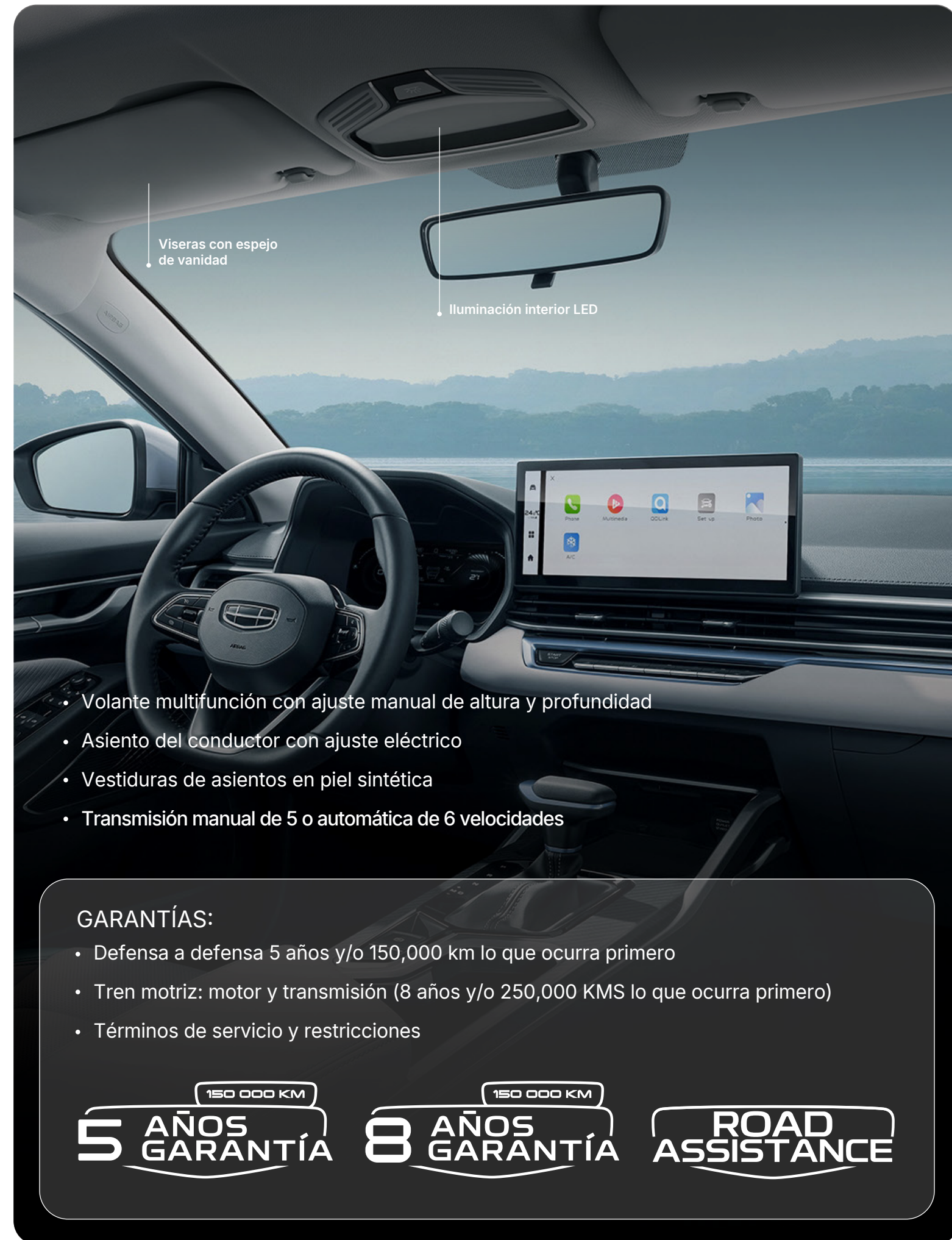
• Viseras con espejo de vanidad