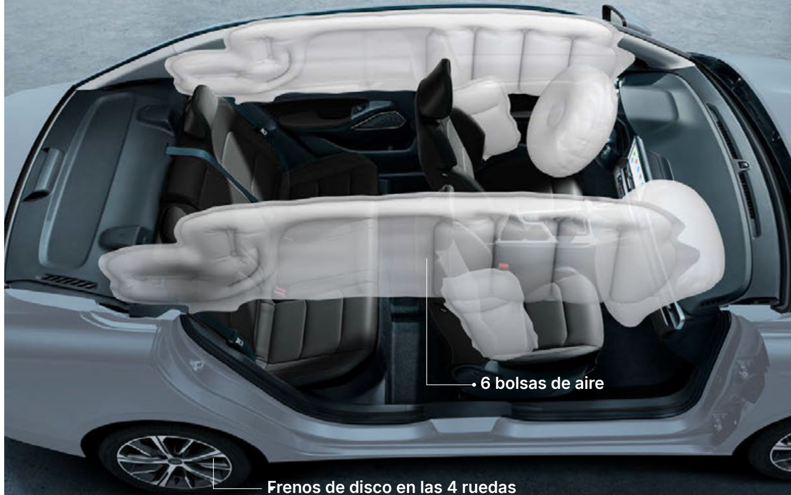
• 6 bolsas de aire