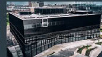
Gothenburg - Sweden