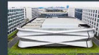
Ningbo - China